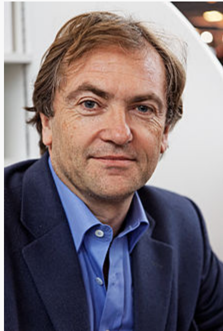
Didier van Cauwelaert au Salon du livre de Paris en 2013.